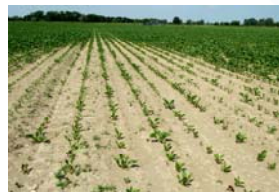
2010, klei pH-KCl = 4,0